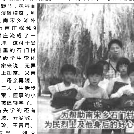
为帮助南宋乡石门村十名失学儿童重返课堂,王为民烈士及他身后的好心人用真情形成了爱的接力